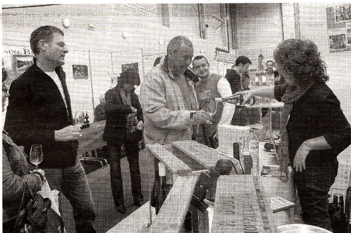
Le Salon des vins de France, une première à Saint-Maur.